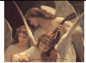
"Canción de los ángeles", detalle, William-Adolphe Bouguereau 1825-1905, francés